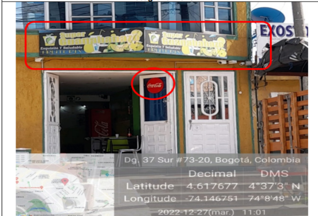
Fotografía en la cual se evidencia un (1) elemento aviso y un (1) afiche ubicado en la ventana y puerta del establecimiento.