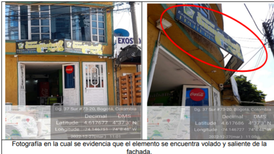
Fotografía en la cual se evidencia que el elemento se encuentra volado y saliente de la fachada.