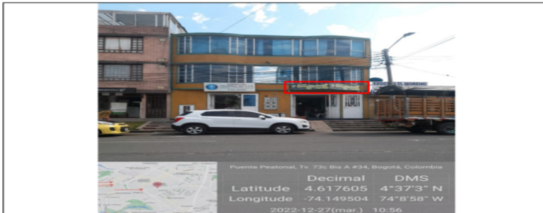
Fotografía panorámica en el cual se evidencia que el elemento aviso de fachada ubicado en el establecimiento no cuenta con solicitud de registro de publicidad Exterior Visual.